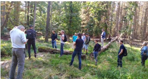
Iets uit het verleden :P een najaarsmeeting

Een groot voordeel als je overstapt, is de besparing die ontstaat op de premie. In de meeste gevallen bespaar je namelijk op de hoogte van de premie van je AOV. Zelfs als je alleen maar switcht van tussenpersoon.