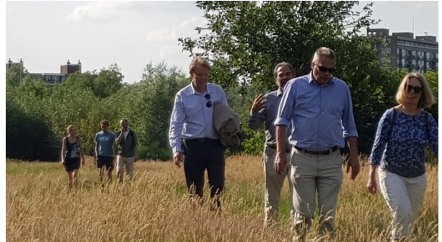
Aan de wandel tijdens onze zomerborrel